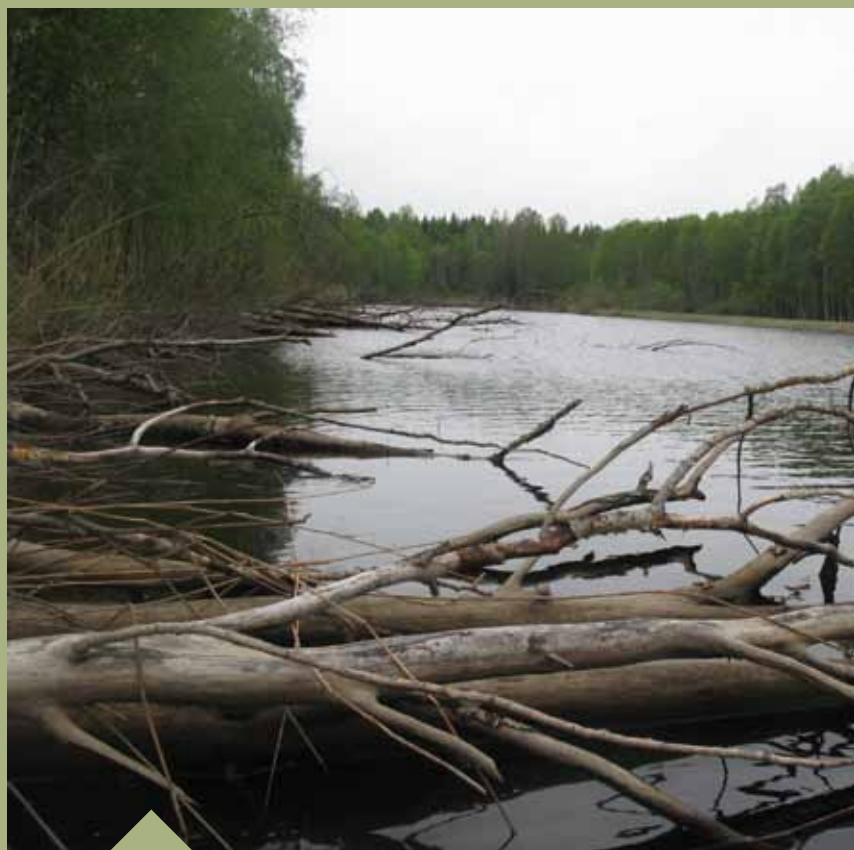
Het geheime riviertje